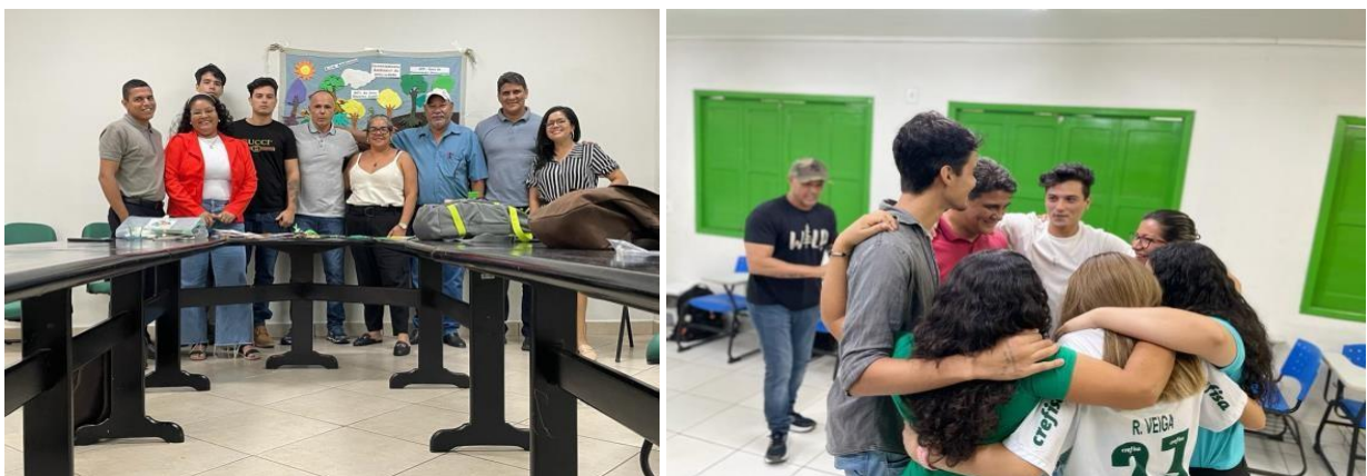
Figura 7 e 8 Oficina de educação ambiental para os estudantes do Instituto Federal do Acre - IFAC.

No dia 18 de maio as equipes ainda realizaram uma oficina de educação ambiental para os estudantes do primeiro período do curso de Agropecuária do Instituto Federal do Acre - IFAC, Campus Rio Branco Baixada do Sol, na capital acreana.