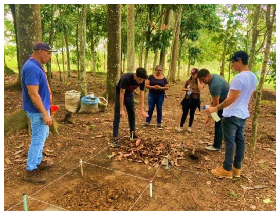
Figura 10 Ação de Educação Ambiental.

A oficina teve como principal objetivo possibilitar aos técnicos realizar atividades de práticas em educação ambiental, para que possam atuar como multiplicadores de boas práticas ambientais, junto a educadores, estudantes, agricultores e comunidades tradicionais do Acre. Durante a capacitação, os técnicos de educação ambiental do IMAC tiveram a oportunidade de conhecer a estrutura do “Viveiro da Floresta” e sua capacidade de produção de mudas de espécies florestais e frutíferas.