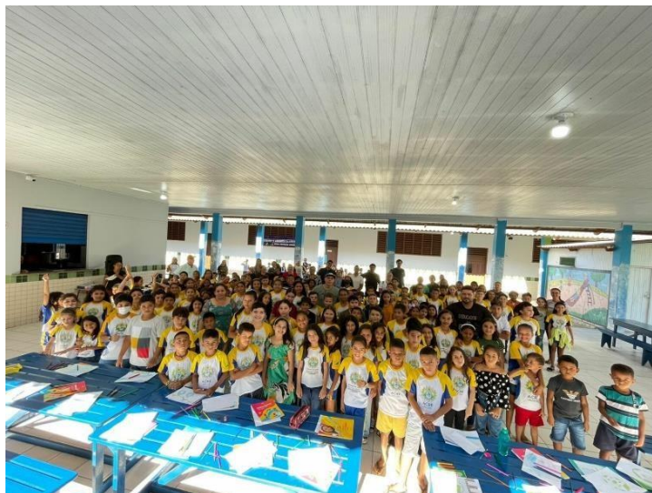
Figura 17 Programa MP na comunidade, edição sobre o Meio Ambiente.

As oficinas de educação ambiental foram realizadas em 4 escolas do ensino fundamental I e II e ensino médio da rede estadual de ensino. Tiveram como objetivo realizar a sensibilização e conscientização dos estudantes em relação aos impactos provocados ao meio ambiente com a prática do desmatamento e queimada ilegais em florestas tropicais e sua relação direta com as mudanças climáticas.