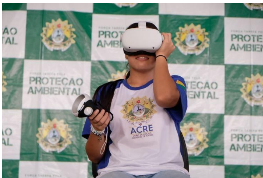
Figura 42 Circuito Ambiental.

13 e 14 de novembro e 01 de dezembro de 2023