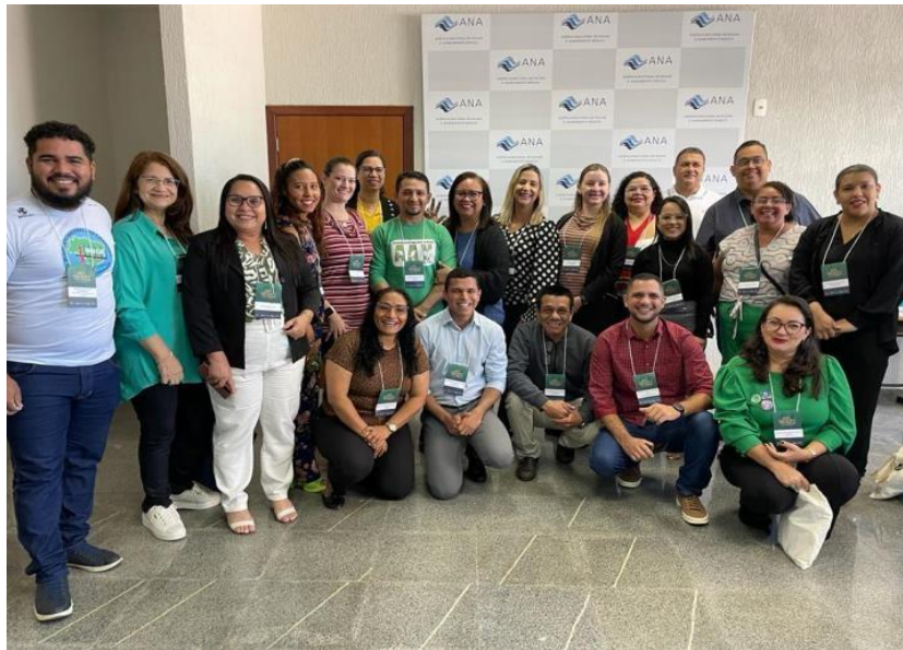
Figura 24 Governo do Acre participa de encontro nacional sobre água, educação e meio ambiente.

Matéria veiculada: https://acesse.one/zcO7Q