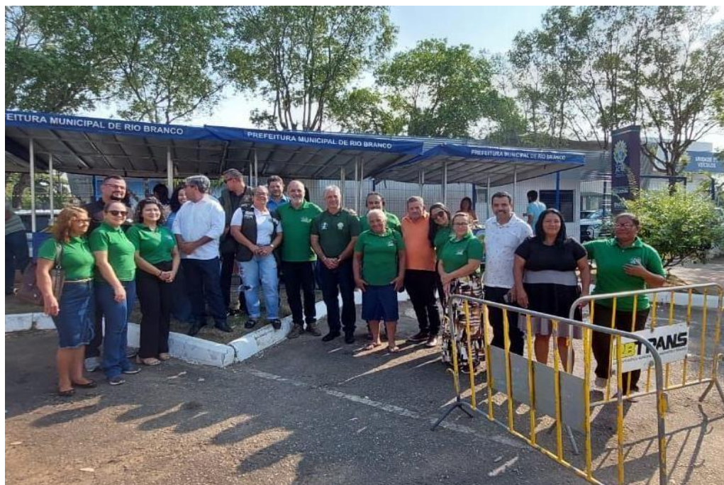
Figura 35 Ação de Conscientização Ambiental com produtores rurais.

A atividade teve como foco trabalhar a conscientização ambiental, alertando à população, bem como os agricultores presentes que estavam realizando exposição dos seus produtos, sobre os perigos das queimadas para a sociedade em geral e o meio ambiente.