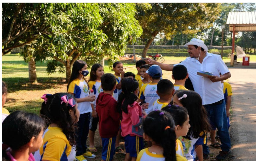
Figura 13 Alunos da rede pública no Viveiro da Floresta.

A atividade ocorreu no Dia Mundial do Meio Ambiente, no Viveiro da Floresta, com crianças da Escola Estadual Zuleide Pereira de Souza. O tema da campanha foi “Me dê que eu planto”, escolhido pensando em conscientizar as pessoas a fazerem a sua parte. Foram feitas ações como o ato simbólico do plantio de um ipê branco e atividades de contato com a natureza.