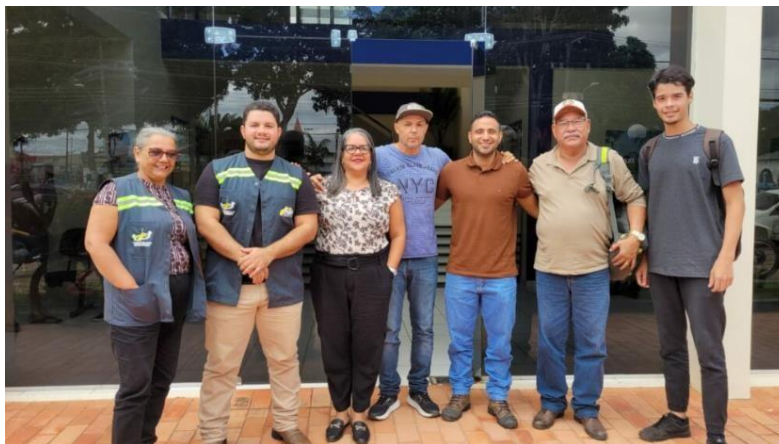
Figura 12 Articulação com Prefeituras e parceiros.

importância da adoção de boas práticas ambientais, para a conservação dos recursos naturais, além de possibilitar aprendizados a respeito dos impactos ambientais provocados pelo desmatamento e queimadas nos municípios.