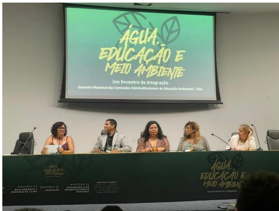
Figura 23 Govorno do Acre participa de encontro nacional sobre água, educação e meio ambiente.

O govorno do Acre, por meio da Secretaria de Estado do Meio Ambiente – SEMA e da Secretaria de Estado de Educação - SEE, participou do Encontro Nacional das Comissões Interinstitucionais Estaduais de Educação Ambiental - CIEA e Encontro Nacional Água, Educação e Meio Ambiente.