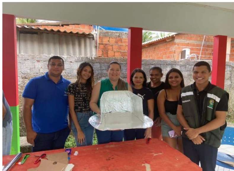
Figura 34 II Oficina de Fogão Solar.

As equipes da Educação Ambiental da Secretaria de Estado do Meio Ambiente - SEMA e do Instituto de Meio Ambiente do Acre - IMAC realizaram a segunda oficina de fogão solar. Na oportunidade, os alunos que participaram da primeira oficina, realizada no Dia da Amazônia (05/06), tiveram a oportunidade de repassar o conhecimento aos colegas de turma.