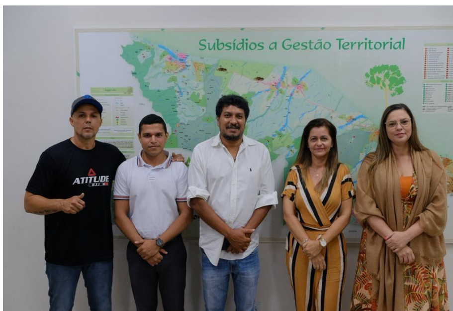
Figura 3 Agenda Institucional com a Secretária Municipal de Meio Ambiente de Porto Walter.

Na pauta, foram apresentados futuros projetos relacionados à Educação Ambiental em processo de atualização. Com a parceria do Governo do Acre, a Prefeitura planeja implementar o Plano de Educação Ambiental e Coleta Seletiva para avançar na sustentabilidade por meio de capacitações e reciclagem com os agentes de educação ambiental.