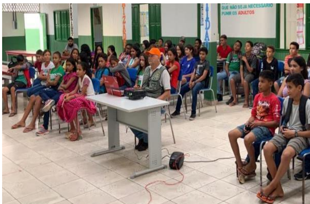
Figura 20 Apresentação Cine Verde.

Na ocasião, foi realizada Oficina de Alternativas sobre o Uso do Fogo para os trabalhadores do Sindicato dos Trabalhadores Rurais do Município de Tarauacá.