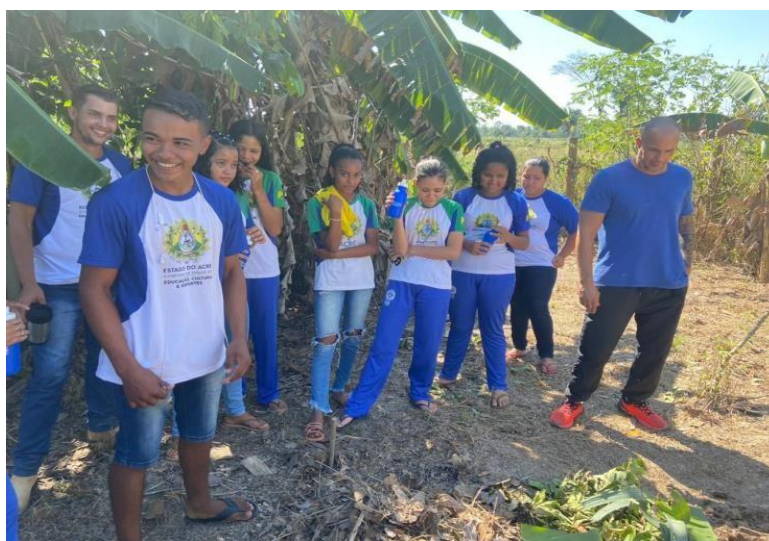
Figura 21 Oficina de alternativas para uso do fogo com crianças.

As atividades estão em consonância com o Plano de Prevenção e Combate do Desmatamento e Queimadas do Estado do Acre (PPCDQ-AC) e ao decreto de Situação de Emergência Ambiental validado para os meses de julho a dezembro de 2023 (Decreto nº 11.271, de 4 de julho de 2023), como medida preventiva em razão da alta probabilidade de ocorrência de incêndios florestais, diante dos baixos índices de chuvas neste período em todo o estado.