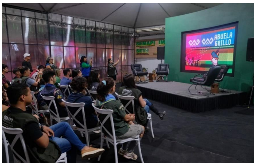
Figura 27 Apresentação do Cine Verde com a animação Vovó Grilo.

Trabalhar a consciência ambiental desde à infância. Esse é um dos objetivos do Cine Verde, atividade que as equipes da Educação Ambiental da Secretaria do Meio Ambiente – SEMA e do Instituto de Meio Ambiente do Acre - IMAC trouxeram Em 2023 para a Expoacre.