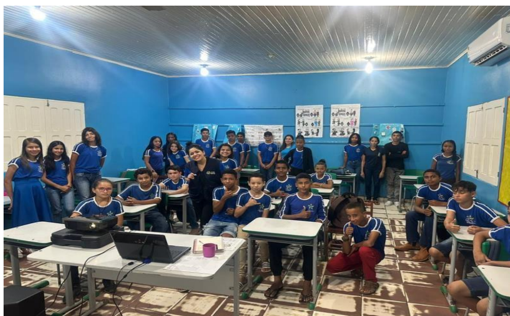
Figura 19 Oficina de Educação Ambiental em Manoel Urbano.

Foram contempladas as escolas Antônia Mendes, Dom Próspero Bernardi e Maria das Graças Rocha Rodrigues.