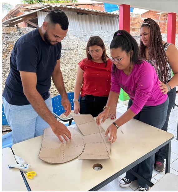
Figura 33 Oficina de Fogão Solar.