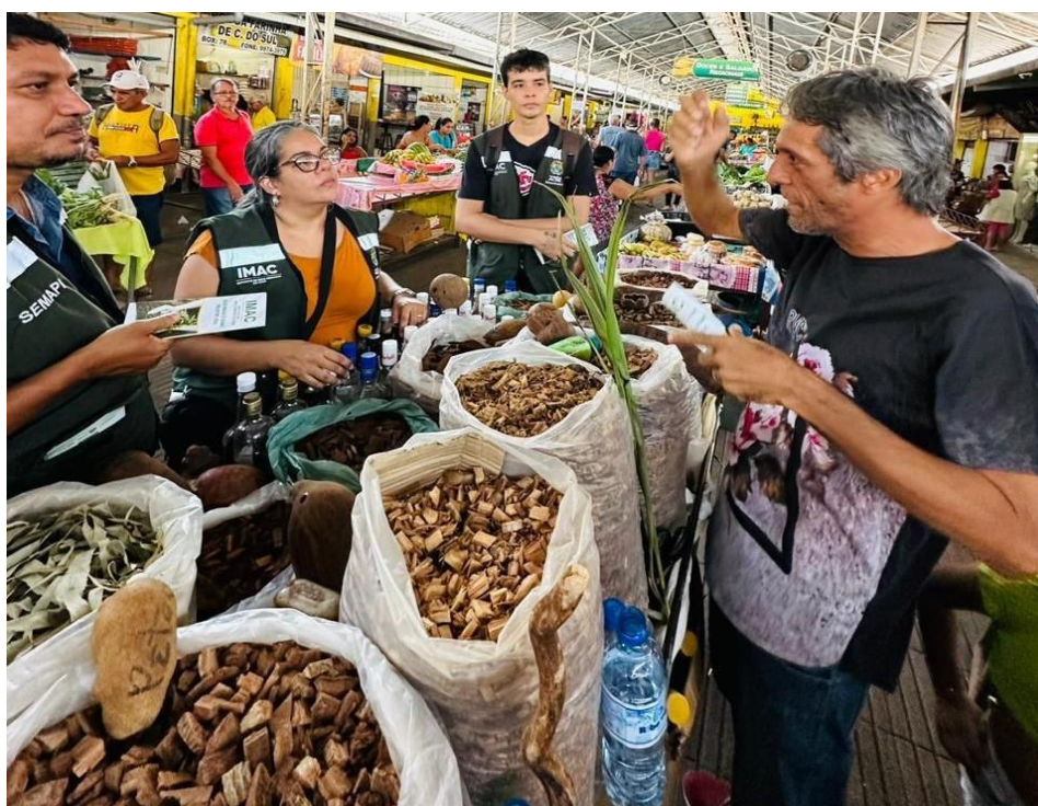
Figura 36 Blitz Ambiental em Feira Municipal.

Informações relacionadas ao impacto das queimadas no meio ambiente, na saúde e economia, além das soluções de como evitar as queimadas e possíveis alternativas, foram passadas aos produtores.