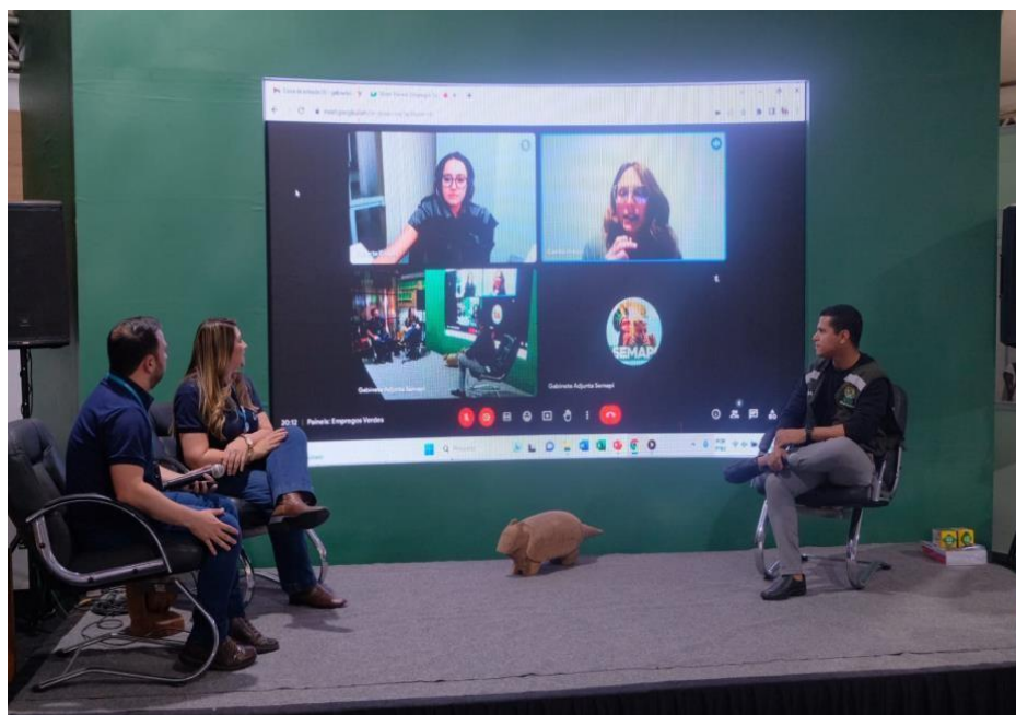
Figura 26 Painel “Empregos Verdes” durante a Expoacre.

A temática dos empregos verdes, uma iniciativa que busca aliar o mercado de trabalho, a produção de energia e o meio ambiente, foi o assunto central discutido durante painel realizado no estande Caminhos para a Sustentabilidade, promovido pela Secretaria do Meio Ambiente - SEMA.