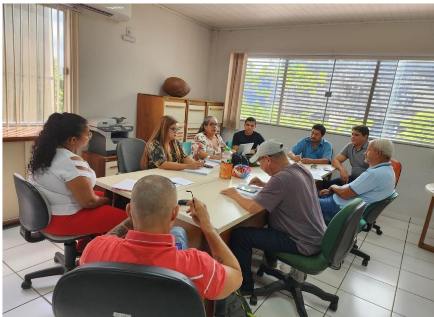
Figura 38 Reunião de Planejamento do Comitê de Crise