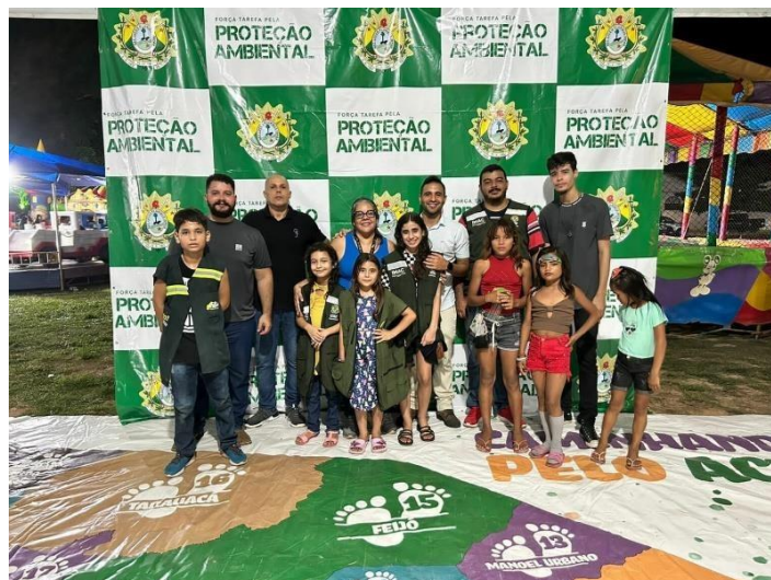
Figura 30 Atividade de Educação Ambiental durante o Festival do Açaí.

Foram realizadas brincadeiras, jogos, palestras e explicações relacionadas à consciência ambiental e a importância do meio ambiente para a vida da população. Uma das atividades que mais chamou a atenção foi o jogo ambiental com o tapete Caminhos para a Sustentabilidade, onde os participantes respondem perguntas relacionadas ao estado.