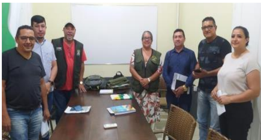
Figura 28 Reunião com Secretário de Meio Ambiente, Saúde, Agricultura e Chefe do Gabinete da Prefeitura de Xapuri.

As reuniões ocorridas nos municípios de Xapuri, Brasiléia, Epitaciolândia e Assis Brasil, possibilitaram o levantamento das atividades que já vêm sendo desenvolvidas pelas Prefeituras, por meio das Secretarias Municipais de Meio Ambiente, Defesa Civil Municipal e Núcleos de representação do IMAC, para o enfrentamento do desmatamento e queimadas nos períodos de criticidade. As reuniões tiveram como objetivo propor uma parceria institucional com os municípios que estão citados no Decreto nº 11.271, de 4 de Julho de 2023 (que declarou Situação de Emergência Ambiental em decorrência do desmatamento ilegal, queimadas, incêndios florestais e degradação florestal), e municípios do entorno, visando ampliar e fortalecer iniciativas e promover atividades de educação ambiental, junto a técnicos, educadores, estudantes e comunidades tradicionais.