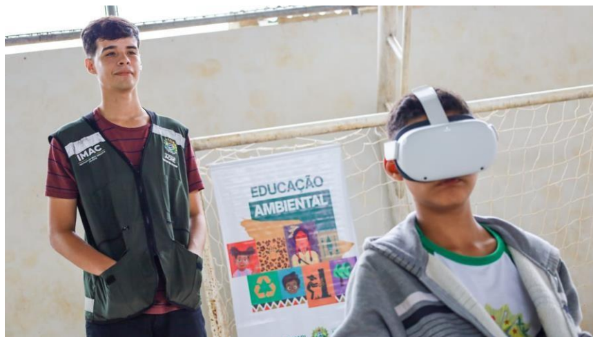
Figura 45 Circuito Ambiental.

Entre as atividades realizadas estão um tour pelo Rio Acre, por meio dos óculos de realidade virtual, com o qual os alunos puderam ver a situação em que o manancial se encontra diante dos eventos extremos que o Acre e demais estados da região amazônica enfrentam.