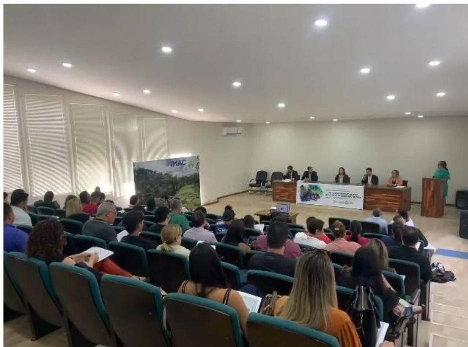
Figura 4 Oficina de atualização das normativas ambientais para servidores.

sobre a Instrução Normativa Imac nº 01, de 26 de dezembro de 2022 e o Decreto nº 6.514, de 22 de julho de 2008, com as alterações dadas pelo Decreto nº 11.080, de 2022.