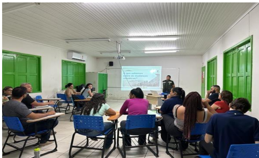
Figura 32 Palestra sobre energias renováveis e mudanças climáticas.

No Dia da Amazônia, 5 de setembro, as equipes da Educação Ambiental da Secretaria de Estado do Meio Ambiente – SEMA e do Instituto de Meio Ambiente do Acre – IMAC realizaram, no Instituto Federal do Acre - IFAC, Campus Avançado Rio Branco Baixada do Sol (CBS), na capital, palestra sobre energia solar e mudanças climáticas.