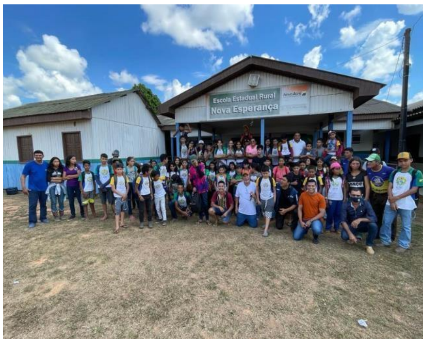
Figura 18 Alunos durante oficina de Educação Ambiental.

As atividades estão em consonância com o Plano de Prevenção e Combate do Desmatamento e Queimadas do Estado do Acre (PPCDQ-AC) e ao decreto de Situação de Emergência Ambiental validado para os meses de julho a dezembro de 2023 (Decreto nº 11.271, de 4 de julho de 2023), como medida preventiva, em razão da alta probabilidade de ocorrência de incêndios florestais, diante dos baixos índices de chuvas neste período em todo o estado.