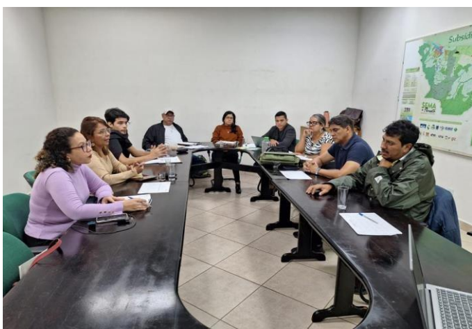
Figura 16 Planejamento com o Ministério Público Estadual – MPE.

A reunião contou com a participação das equipes de educação do IMAC e SEMA, além de duas técnicas do Centro de Apoio Operacional de Defesa do Meio Ambiente, Patrimônio Histórico e Cultural e Habitação e Urbanismo – CAOP/MAPHU do Ministério Público Estadual – MPE, para alinhar as atividades a serem realizadas pelas instituições durante o evento intitulado “Ministério Público na Comunidade – Meio Ambiente”, sendo esta a primeira edição do programa MP na Comunidade temático. Durante a reunião ficou definido que a SEMA apoiaria o evento com a realização de palestras para produtores rurais sobre “Alternativas ao Uso do Fogo” e sobre o Programa de Regularização Ambiental – PRA e ações de educação ambiental.