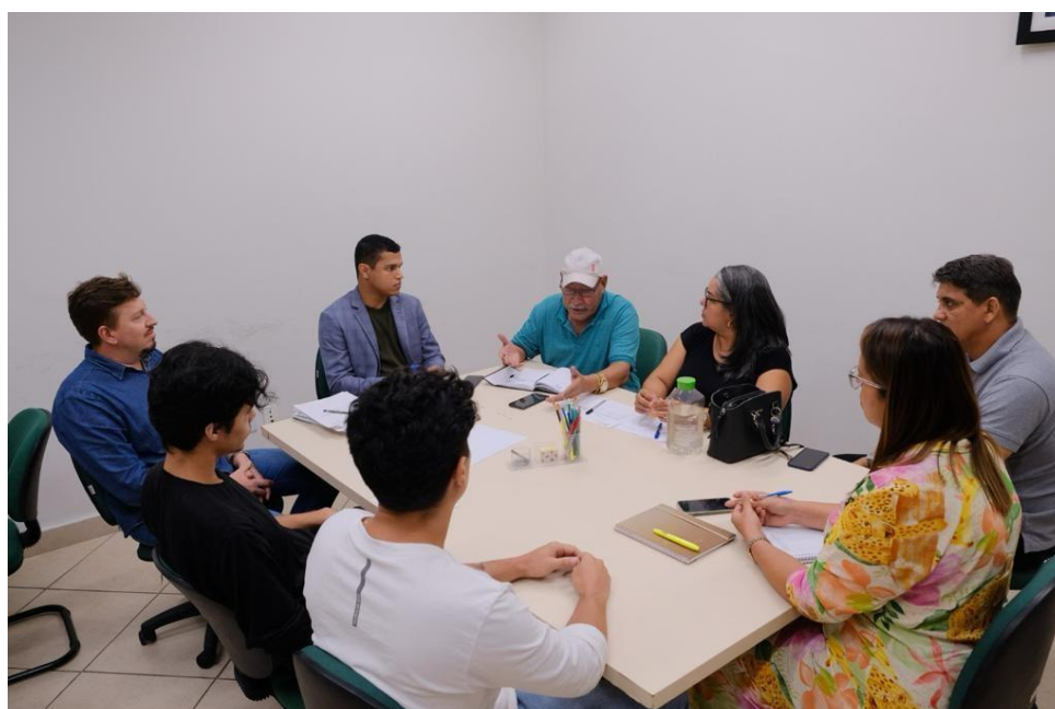
Figura 1 Reunião de Alinhamento em Educação Ambiental.

A Mochila do Educador Ambiental possibilita atividades lúdicas e de aprendizado que oportunizam momentos de expressão, criação e de troca de informação, além de trabalhar a sensibilização para a temática do meio ambiente e a importância dos recursos naturais.