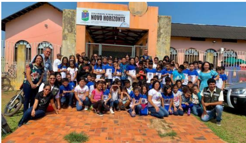
Figura 29 Crianças durante oficina de Educação Ambiental.

Para realizarmos as oficinas adotamos o sistema de rodízio das turmas que funcionou da seguinte maneira: os alunos passaram por cada sala temática. O objetivo deste rodízio foi proporcionar diversas experiências que os permitisse criar um novo olhar para as questões ambientais.