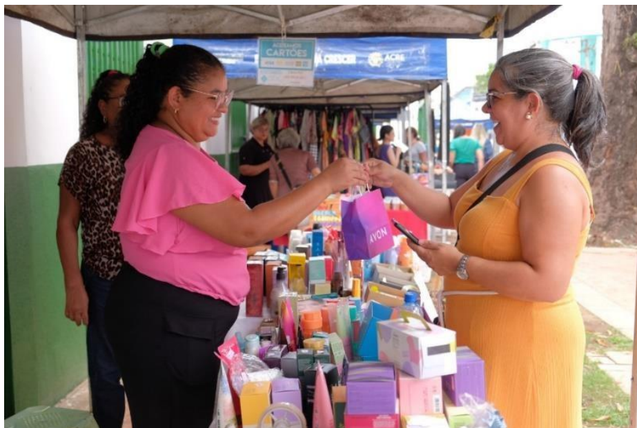
Figura 41 Representantes da SEMA e IMAC durante a Feira.

A atividade objetivou incentivar e dar visibilidade ao trabalho das empreendedoras e contou com representantes da Coordenadoria de Educação Ambiental-CEA da SEMA.