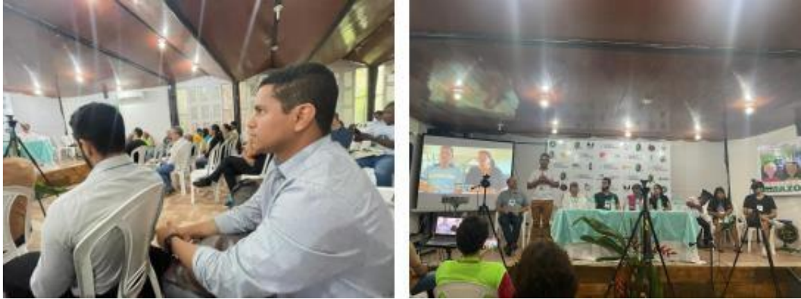
Figura 5 e 6 Participação no II Encontro Energia & Comunidades.