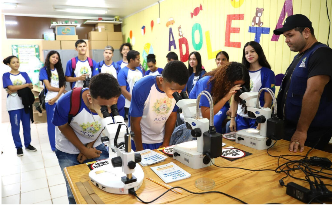
Figura 44 Circuito Ambiental.

Na oportunidade, também foi usado o jogo educativo Vila da Farinha, uma doação da Embrapa, reafirmando a parceria do Estado com os órgãos que compõem a agenda ambiental.