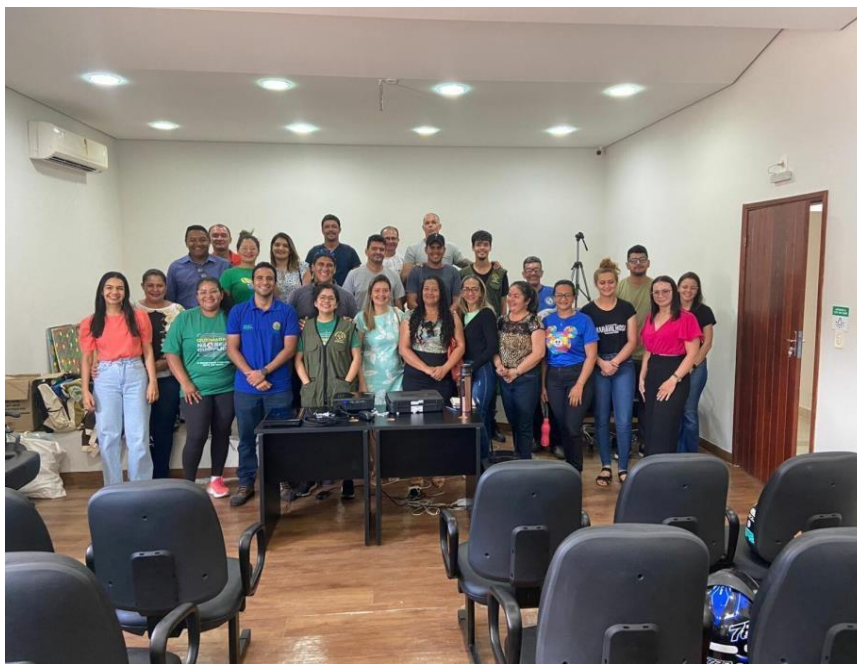
Figura 22 Oficina de Capacitação em Feijó.