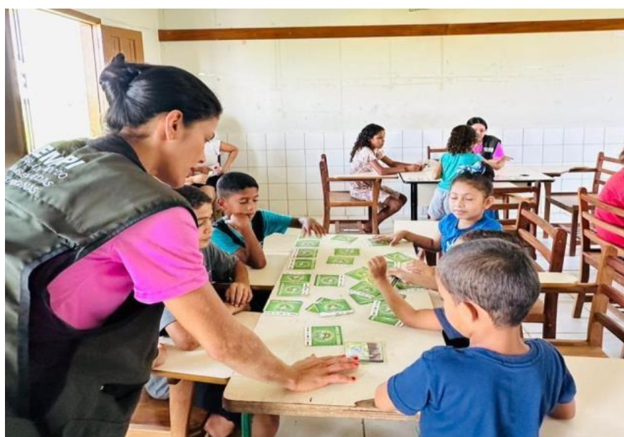
Figura 39 Oficina de Educação Ambiental.

Foram realizadas ações de educação ambiental, focadas nos recursos hídricos, como forma de conscientização devido ao período de seca prolongada no estado.