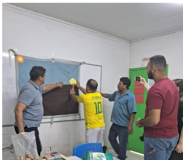
Figuras 14 e 15 II Oficina em Educação Ambiental para Estudantes do IFAC.