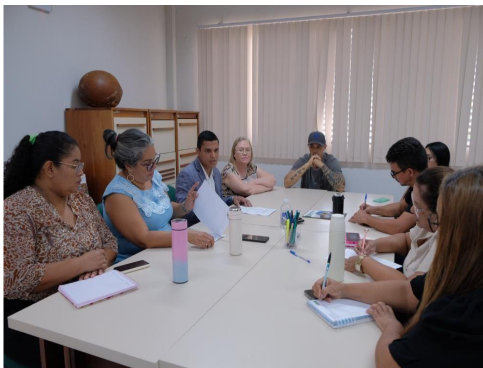
Figura 37 Reunião de Planejamento do Comitê de Crise.

O resultado das atividades de educação ambiental, prevenção de doenças e conscientização de estudantes estão apresentadas neste relatório. Integram o grupo a Secretaria de Estado do Meio Ambiente – SEMA, Instituto de Meio Ambiente do Acre - IMAC, Secretaria de Estado de Comunicação - SECOM, Secretaria de Estado de Saúde do Acre – SESACRE, e Secretaria de Estado da Educação, Cultura e Esportes – SEE.