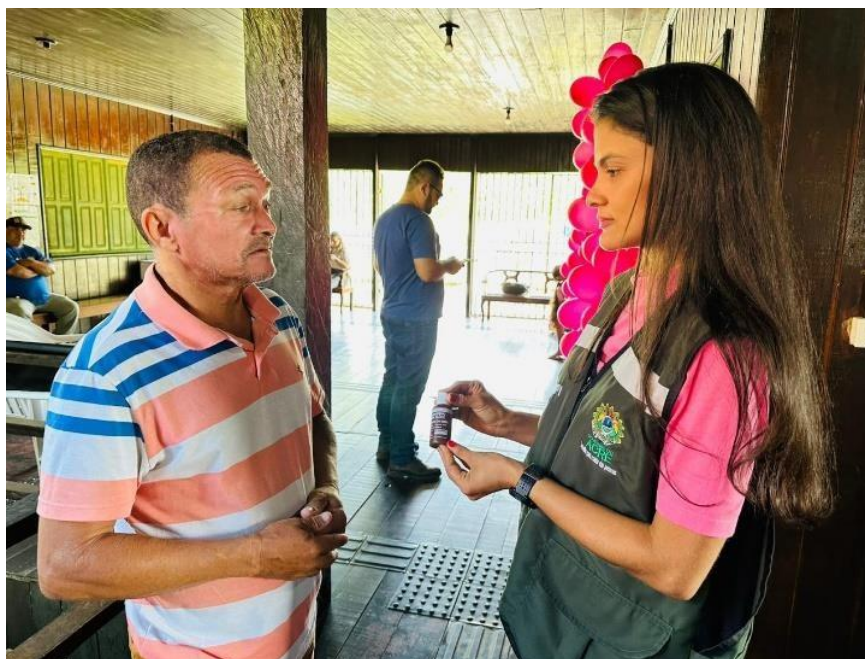
Figura 40 Entrega do hipoclorito de sódio aos moradores das florestas públicas.

Foi iniciada, ainda, a entrega do hipoclorito de sódio aos moradores das florestas públicas do Tarauacá/Envira e Juruá, e entorno, atividade integrada entre a Secretaria de Estado da Saúde - SESACRE, Secretaria de Estado do Meio Ambiente - SEMA, e Serviço de Água e Esgoto do Estado do Acre - SANEACRE. A ação faz parte do protocolo do “Comitê de Crise de enfrentamento à Seca Prolongada”, coordenado pela Secretaria de Governo - SEGOV para dar suporte e apoio às famílias.