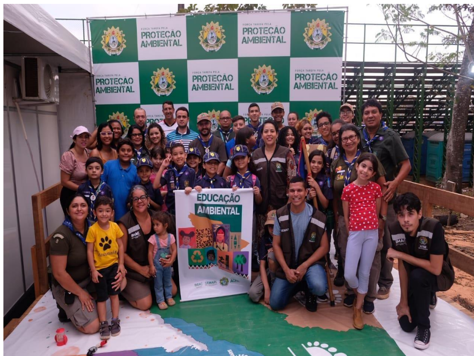
Figura 25 Ação de Educação Ambiental na Expoacre.

Com uma programação que incluiu uma gincana ambiental, atividades na trilha escoteira, visita à vitrine tecnológica da Empresa Brasileira de Pesquisa Agropecuária -