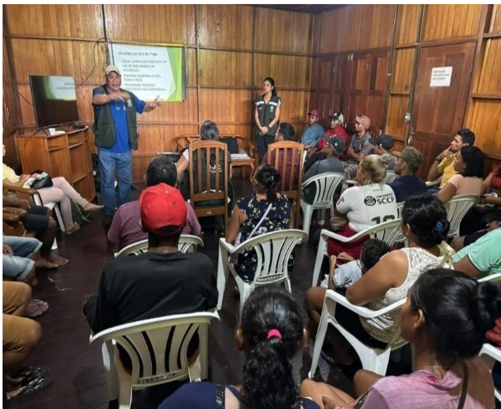
Figura 47 Ação de Educação Ambiental.

O Complexo de Florestas Estaduais do Rio Gregório (Cferg) foi criado em 2008 pelo decreto estadual nº 3.433/08, abrangendo três unidades de conservação de uso sustentável: Floresta Estadual do Rio Gregório, Floresta Estadual do Mogno e Floresta Estadual do Rio Liberdade, situadas entre os municípios de Cruzeiro do Sul e Tarauacá.