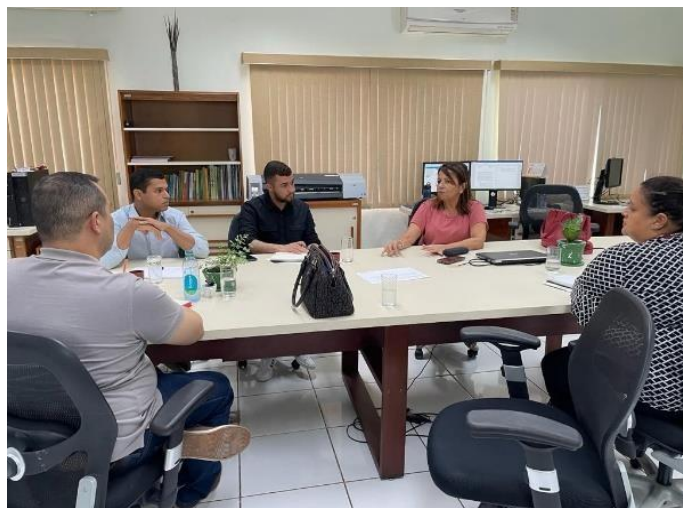
Figura 11 Reunião com o Ministério Público do Estado do Acre.