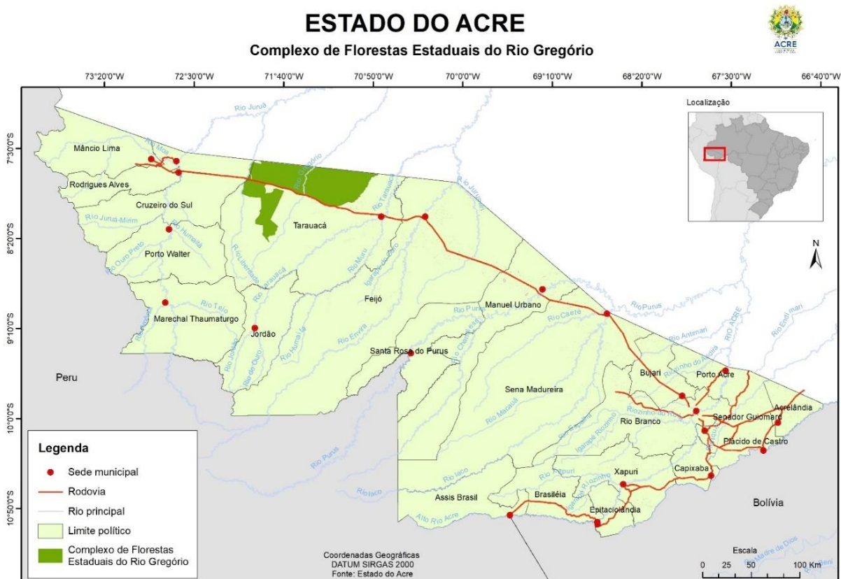
Figura 3. Florestas Estaduais passíveis de concessão florestal.

* Área informada no Cadastro Nacional de Florestas Públicas